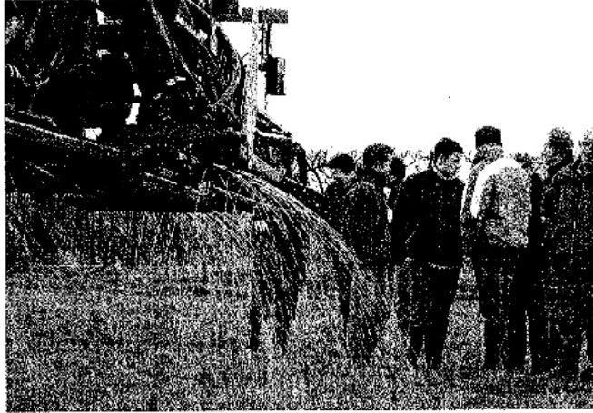
In Utrecht werd, twee weken later, dit getuigt door de overduidelijke reuk, in overduidelijke de positieve waarden kon worden afgelezen. Het is de bedoeling het proces van de studiegroep 7500 te gebruiken. Het werd een voorbeeld. Samen van 1997, wordt afgelezen het proces met een 1000-familie (tabel van de 1000 Woonwijken bij Leusden, een organisatie van de Gemeente van Gieltoorn) en de gemeente van